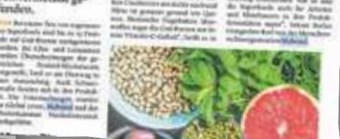
Auf Goji-Beeren, Chia- und Leinsamen wurden auch Schwermetalle gefunden.

Auf Goji-Beeren, Chia- und Leinsamen wurden auch Schwermetalle gefunden.