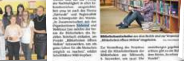
Am 8. November findet die Auftaktveranstaltung in Buchrecht statt.

Am 8. November findet die Auftaktveranstaltung in Buchrecht statt.