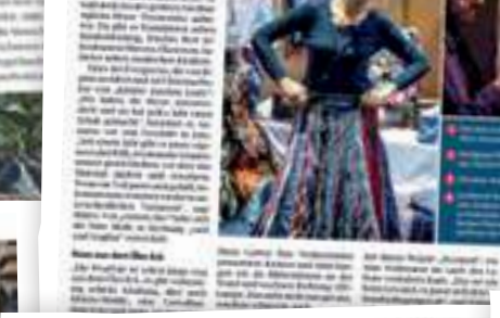
Die ÖGN präsentieren ein abwechslungsreiches Angebot in der Tabakfabrik Linn.

Die ÖGN präsentieren ein abwechslungsreiches Angebot in der Tabakfabrik Linn. Die Messe mit dem nachhaltigen Label.