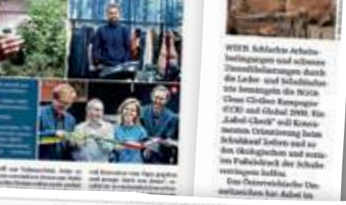
WIEH: Schlechte Arbeitsbedingungen und schwere Dienstleistungen durch die Leder- und Schuhindustrie.

WIEH: Schlechte Arbeitsbedingungen und schwere Dienstleistungen durch die Leder- und Schuhindustrie.