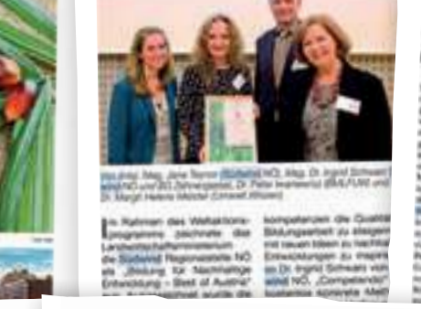
Das Team von 'Competendo' bei der Preisverleihung.

Das Projekt „Competendo“ wurde für seine innovative Arbeit in der Digitalisierung ausgezeichnet.