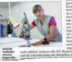
Arbeiter in einer Textilfabrik.

Hausgemachte und handwerkliche Arbeitsbedingungen in der Textilindustrie sind weltweit ein Problem. In Österreich sind die Bedingungen in den Textilfabriken oft sehr schlecht.