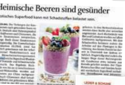
Heimische Beeren sind gesünder als exotisches Superfood.

Exotisches Superfood kann mit Schadstoffen belastet sein. Heimische Beeren sind eine gesündere Alternative.