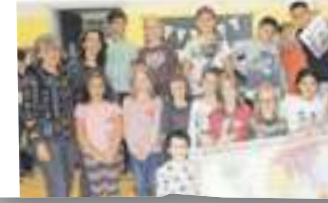
„Gute Arbeit mit dem Schoko-Check 2017. Die Initiative der ÖGN.

„Gute Arbeit mit dem Schoko-Check 2017. Die Initiative der ÖGN.