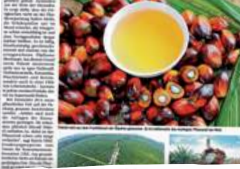
Palmöl-Produkte in Supermärkten.

In jedem zweiten Supermarkt-Produkt steckt Palmöl. Es ist billig und schwer ersetzbar. Doch die steigende Nachfrage führt zu Produktionen und einem unethischen Palmölmarkt.