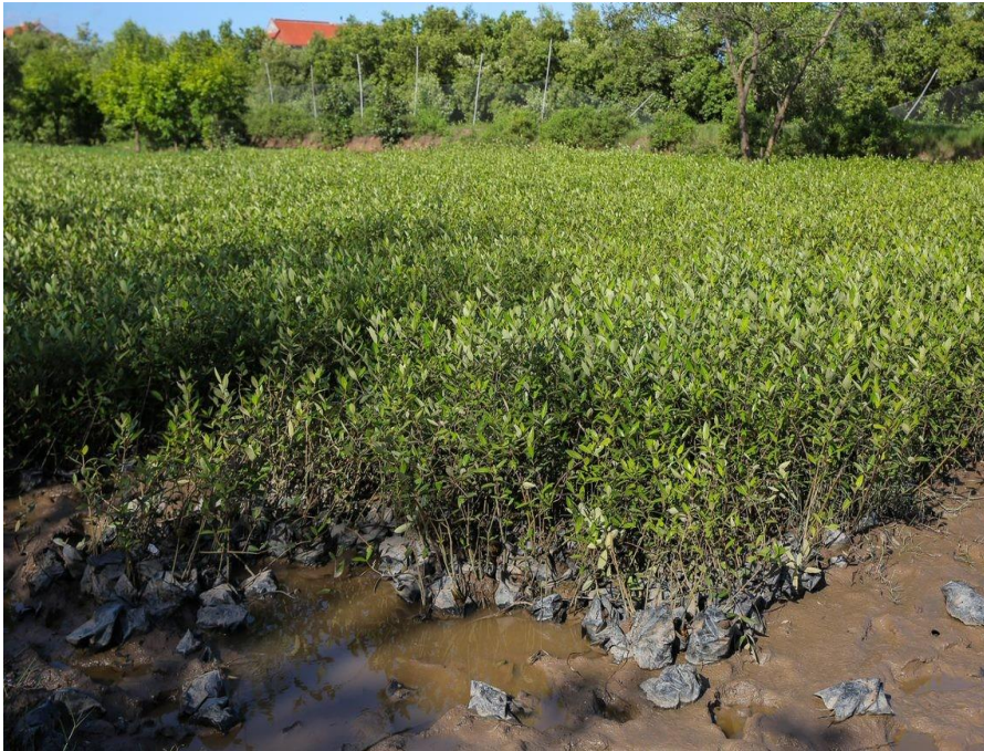
Mangrovensetzlinge in der Baumschule

Die Mangrovenwälder in den drei Projektgemeinden werden durch gemeinsame Schutzbemühungen von Gemeinden und (lokalen) Regierungen besser erhalten und tragen zur Kohlenstoffbindung bei.