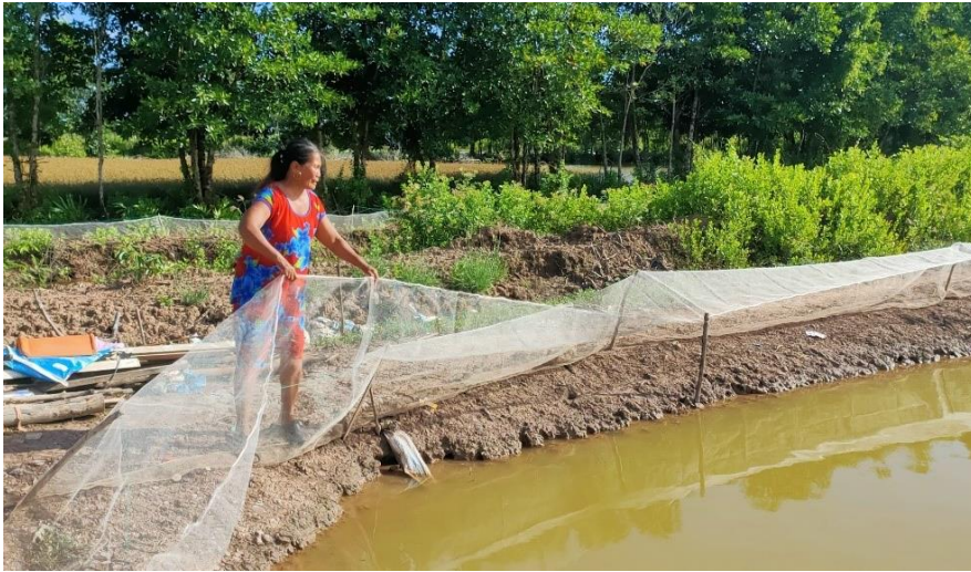
Ausbreiten der Netze auf den Krabbenteichen

Die Lebensgrundlagen der Gemeinden werden durch den offiziell anerkannten und kontrollierten Zugang zu nachhaltiger, umweltfreundlicher Silvo-Aquakultur in den Mangrovenschutzwäldern verbessert, was zur nachhaltigen Ernährungssicherung beiträgt.