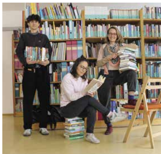
Das Südwind-Team freut sich auf Ihren Besuch!