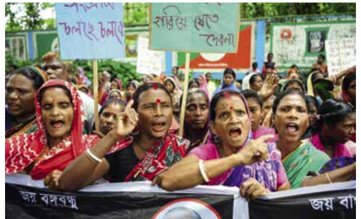
Im August streikten in Bangladesch 150.000 Teearbeiter*innen von 232 Plantagen für mehr Lohn – gefordert wird die Erhöhung des Mindestlohnes von 1,20 Euro am Tag. Mehr als 75% der Arbeiter*innen sind weiblich.

Die Anbaubedingungen sind auch heute noch problematisch: Die Ausbeutung der Arbeiter*innen steht genauso auf der Tagesordnung wie der Einsatz hochgiftiger Pestizide. Welche Alternativen und Handlungsmöglichkeiten es gibt, wird in der Ausstellung thematisiert.