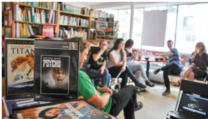
Die IFFI-Jurymitglieder beim Filmworkshop in der Nord-Süd-Bibliothek. Auch Filmklassiker dürfen nicht fehlen!