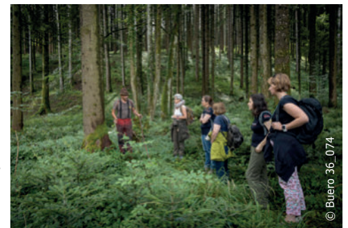
Wissensaustausch beim Wandern