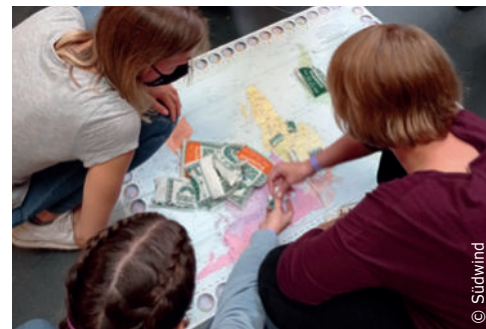
Teilnehmer*innen vom Youthlab

Ein Glücksrad zu den 17 Zielen für nachhaltige Entwicklung war der Blickfang, der zusätzlich Besucher*innen an den Stand lockte, die durch Videos, Fotos und Texte Einblicke in das vielfältige Engagement von Aktivist*innen bekamen. Wer selbst gleich vor Ort ein Zeichen setzen wollte, konnte eine Petition zu Klimagerechtigkeit und fairer Migrationspolitik unterschreiben.