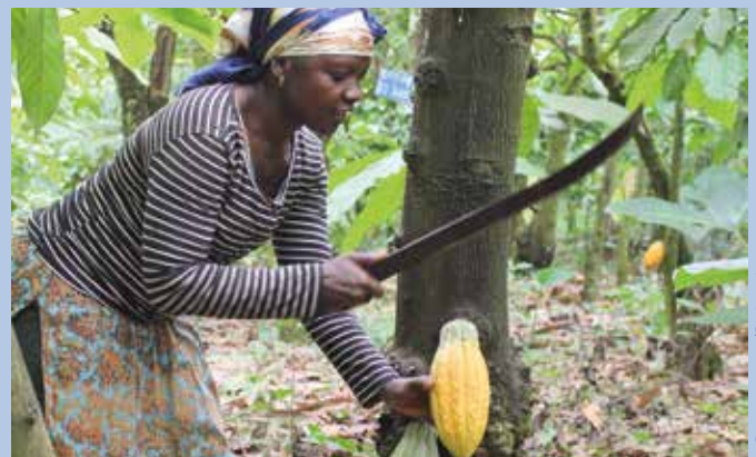
Kakaobäuerin auf ihrer Farm in Kamerun

Mit etwa 70% stammt der Großteil des weltweit hergestellten Kakao aus den vier westafrikanischen Ländern Elfenbeinküste, Ghana, Nigeria und Kamerun. 4 Dort liegt der Kakaoanbau zu 80 - 90% in den Händen von Kleinbäuerinnen und -bauern, mit einer durchschnittlichen Farmgröße von 2 – 4 Hektar. 5