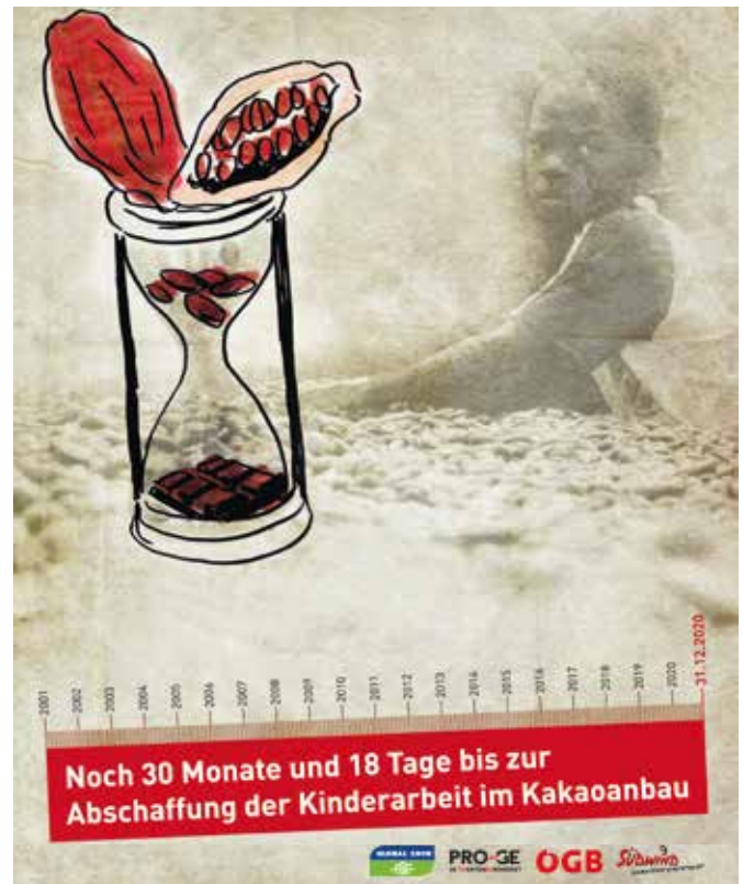
12.6.2017 - Internationaler Tag gegen Kinderarbeit: 2001 haben sich alle großen Schoko-Unternehmen auf das Ende von Kinderarbeit im Kakaoanbau geeinigt. Die Frist dafür läuft am 31.12.2020 aus.

Kinder (wie auch Erwachsene) schleppen bis zu 50-Kilo-Säcke und tragen schwere Wasserbehälter auf dem Kopf. Viele sind von Rückenschmerzen geplagt, werden von giftigen Schlangen attackiert 15 , erleiden Leistenbrüche und manchen Kindern wächst ein Buckel. Sie verletzen sich mit Macheten und anderen Erntegeräten, was zu gefährlichen Infekti-