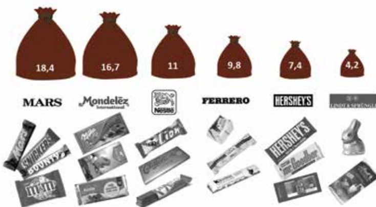
Anteil am weltweiten Umsatz des Süßwaren- und Schokoladenmarktes (in Prozent, 2015) 11

Konzerne fast 70% des Marktes beherrschen. Und auch bei den Supermarktketten ist eine Konzentration feststellbar. So kontrollieren beispielsweise in Österreich drei Handelsketten (REWE, Spar, Hofer) ca. 85% des Marktes. Aufgrund des steigenden Anteils von Eigenmarken-Schokoladenprodukte trägt auch die Konzentration im Einzelhandel zu einer zunehmenden Abhängigkeit der ProduzentInnen bei. 10